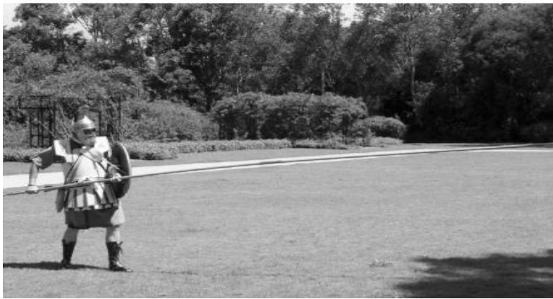
Figura 3- Falangista observando a posição das mãos e posição quando segura a lança de 5,00m