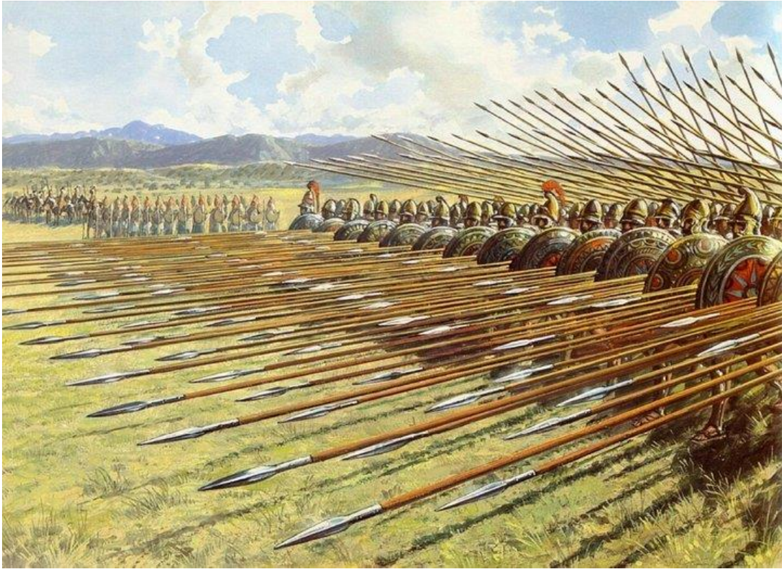
Figura 4- Falange com os falangista da Macedônia, com sua lança de 5,00m.