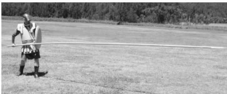
Figura 1- Na foto superior está o primeiro hoplita com lança de 2,5m e abaixo está o falangista criado por Felipe II da Macedônia;