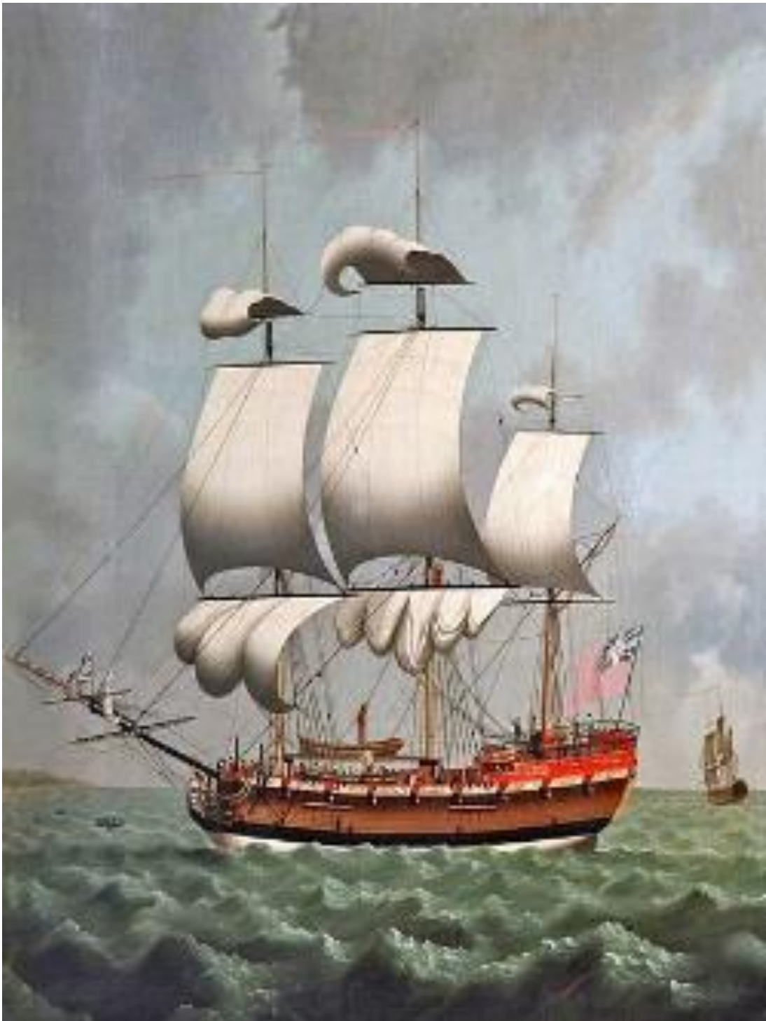
Figura 2- Veleiro escravagista que saia de Liverpool na Inglaterra