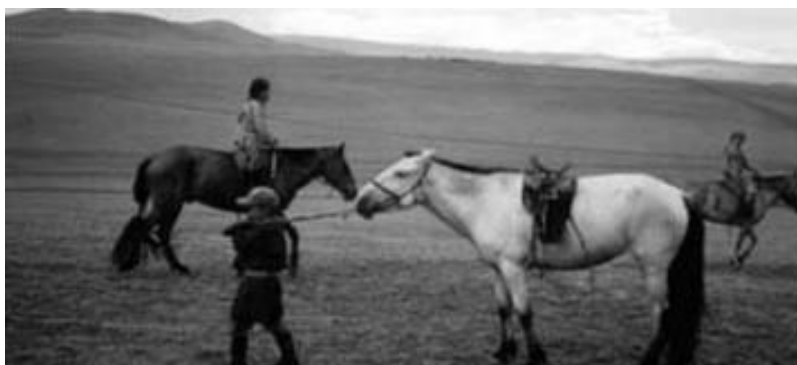
Figura- Cavalo dos mongóis.

Os cavalos podiam comer capim enterrados na neve até 0,50m e comiam qualquer coisa, como folhas de árvores.