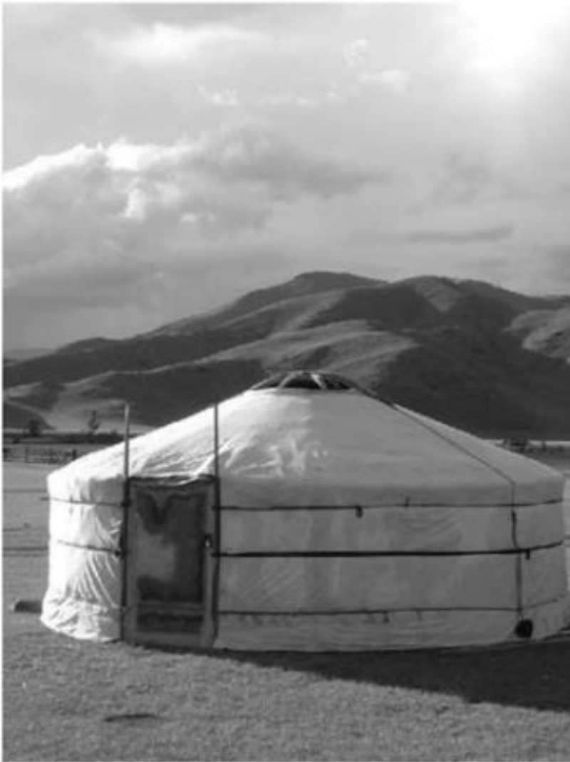
Figura 2- Tenda dos mongóis que podia ser desmontada em 1 hora.